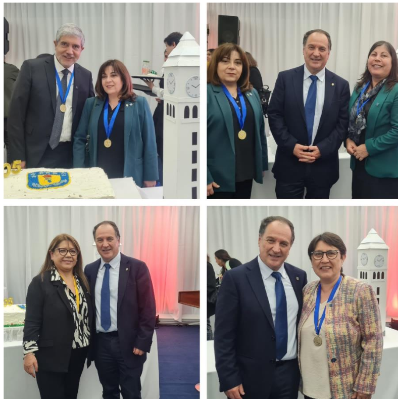
Imágenes de algunas de nuestras homenajeadas, en compañía del Decano, durante el tradicional Vino de Honor UdeC.

Parta mí, la Universidad de Concepción, representa la amistad, ha estado en todos los tiempos a mi lado, buenos y malos. Es un crecimiento profesional constante, que te va abriendo puertas, asimismo te acompaña en tus proyectos personales y te ve crecer y cumplir etapas como ser humano. Es una gran satisfacción y orgullo. No lo puedo creer, los años han pasado volando y el balance es muy positivo”.