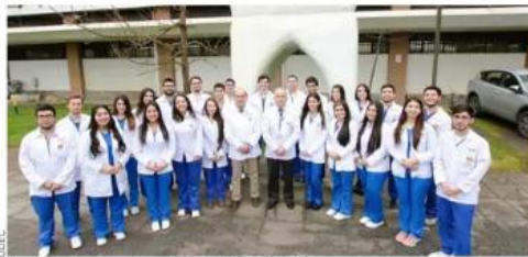
Equipo Facultad de Odontología UdeC.